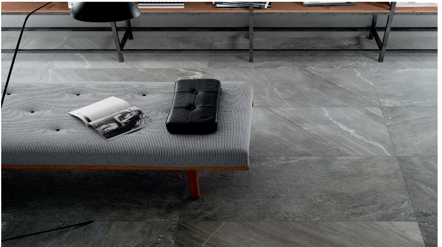
GRIGIO SCURO (Gris foncé)