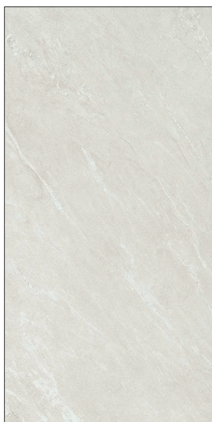
30 x 60 cm (12 x 24) OE.PS.CRD.1224.MT