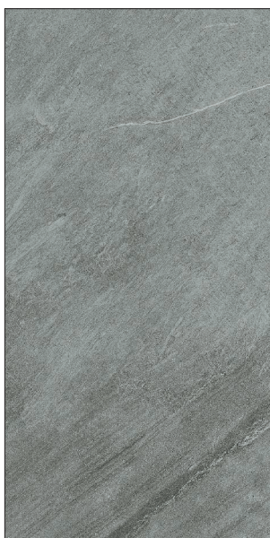
30 x 60 cm (12 x 24) OE.PS.GRU.1224.MT