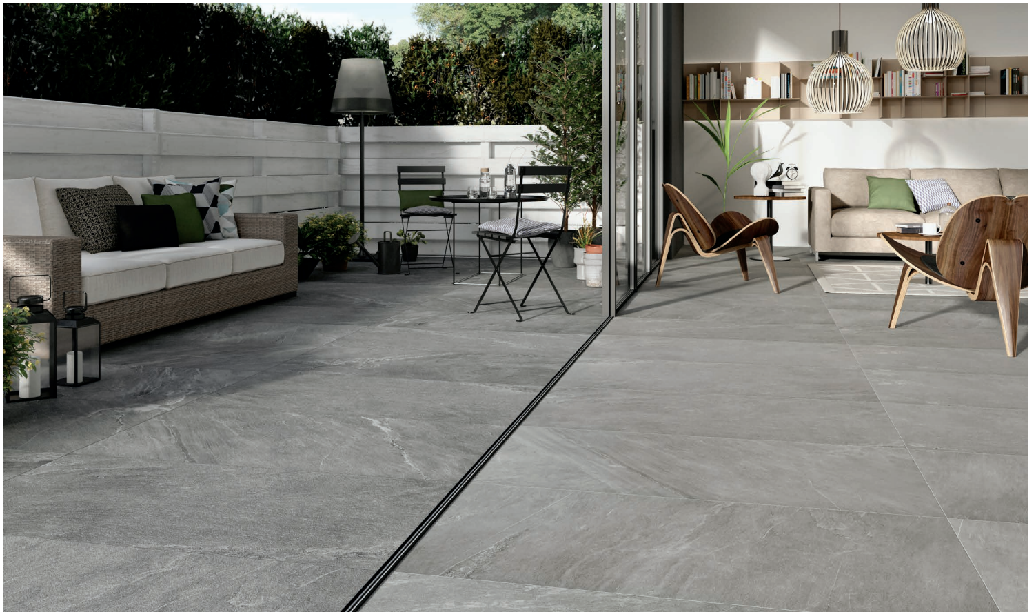
GRIGIO SCURO (Gris foncé)