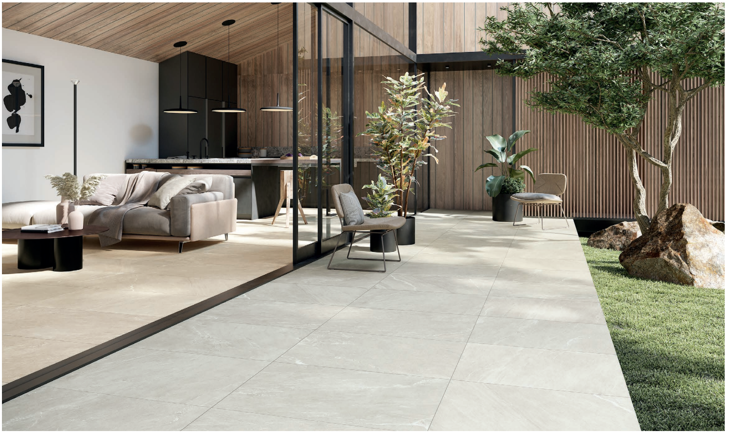
CORDA (Blanc cassé)