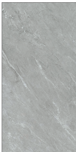
30 x 60 cm (12 x 24) OE.PS.GRC.1224.MT