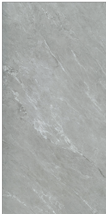
45 x 90 cm (18 x 36) OE.PS.GRC.1836.MT

Tous les items présentés dans ce document font partie du programme d'inventaire Olympia. Pour les commandes spéciales, veuillez contacter votre représentant de Tuiles Olympia.