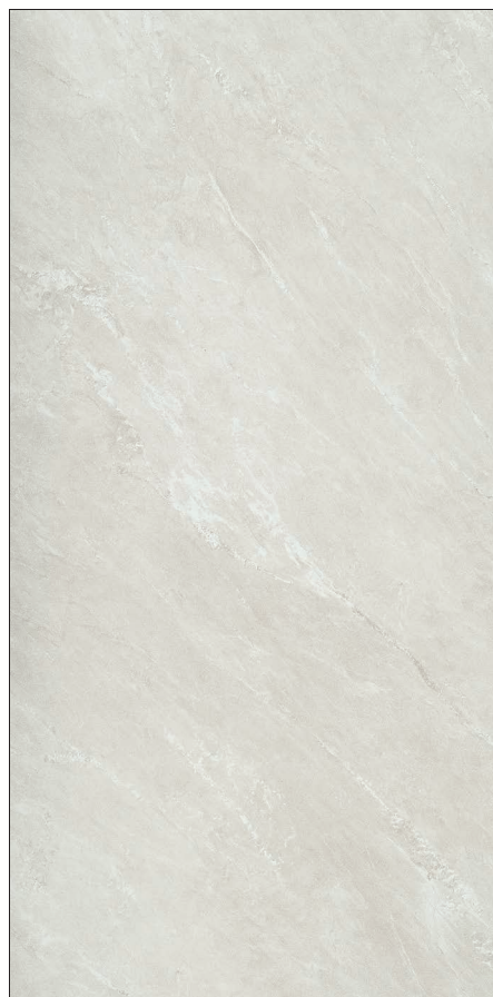
45 x 90 cm (18 x 36) OE.PS.CRD.1836.MT

Tous les items présentés dans ce document font partie du programme d'inventaire Olympia. Pour les commandes spéciales, veuillez contacter votre représentant de Tuiles Olympia.