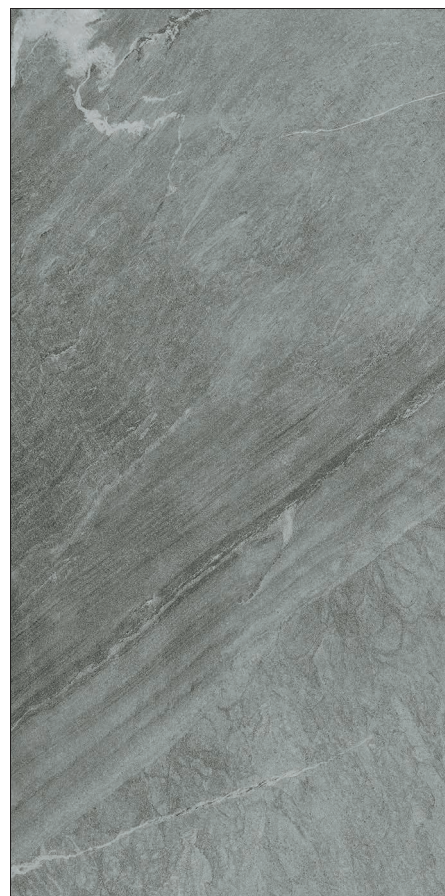
45 x 90 cm (18 x 36) OE.PS.GRU.1836.MT

Tous les items présentés dans ce document font partie du programme d'inventaire Olympia. Pour les commandes spéciales, veuillez contacter votre représentant de Tuiles Olympia.